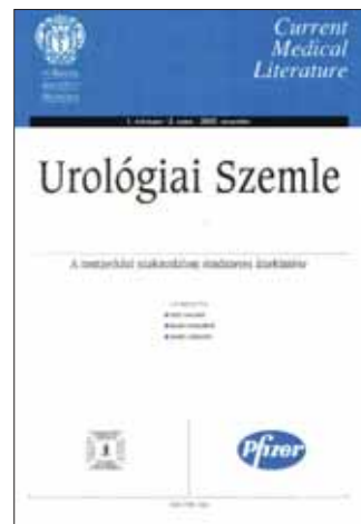
3. ÁBRA: AZ UROLÓGIAI SZEMLE 2003-BÓL

volt, Minder elhagyta az országot. Politikailag egyik sem volt kompromittált. 1947-ben alapította Babics a nemzetközi, idegennyelvű Acta Urologica, amiről később írok, de csak 3 évig működött. 1974-ben, amikor az Urológiai Klinikán dolgozni kezdtem, az urológiai tárgyú dolgozatok a Magyar Sebészet részeként, annak végén jelentek meg, magamé is néhány, szerkesztője Molnár Jenő volt. Balogh Ferenc alapította az Urológiai és Nephrológiai Szemlét 1973-ban (1987-ben szűnt meg) (2. ábra). Rejtély számomra, hogy az Illyés