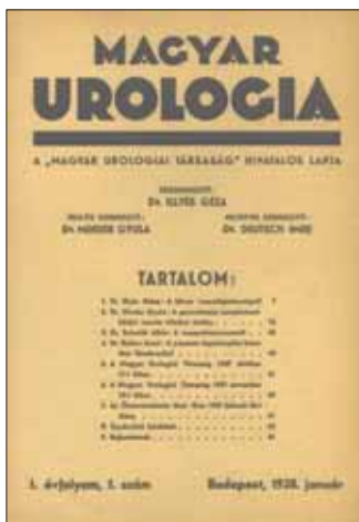
1. ÁBRA: A MAGYAR UROLÓGIA ELSŐ SZÁMA 1938-BÓL

A címként írhatnám „Régi dicsőségünk, hol késel az éjjeli homályban...” – Vörösmarty: Zalán futását idézve, mikor kezembe veszem a véletlenül könyvtáramban megtalált Acta Urologica 1948-as II. kötetét, az 1–12. számát. Nincs az urológiai köztudatban ez a folyóirat.