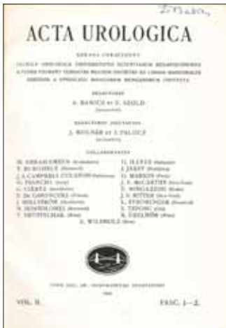
6. ÁBRA: AZ ACTA UROLOGICA 2. KÖTETE, BABICS ALÁÍRÁSÁVAL

(5. ábra). Az ezredforduló körül volt egy „Endoscopia és minimálisan invazív terápia” című lap is, rövid ideig, emlékeim szerint Tóth Csaba szerkesztette (példányom nincs belőle).