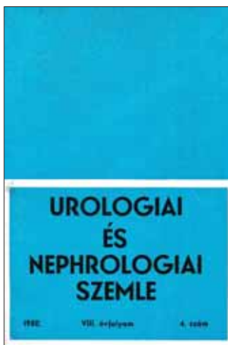
2. ÁBRA: AZ UROLÓGIAI ÉS NEPHROLOGIAI SZEMLE EGY PÉLDÁNYA

téma szerint. Orvosi Hetilap, Orvosképzés, számos szakmai lap, Gyógyászat, még német nyelvű orvosi lap is volt, amiben urológiai vagy határterületi dolgozatok jelentek meg. Az