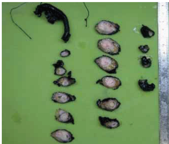
1. ÁBRA: IUP MAKROSZKÓPOS KÉPE

sulnak. Ezek a hámstruktúrák centrálisan érett urothelialis hám-sejteket, míg a perifériás, széli részeken sötétebb festődésű, paliszádszerűen elrendeződött basalis sejteket tartalmaznak. A glanduláris variánst úgy definiálták, hogy ez esetben a tumor urothelialis sejtfészkekből áll, amelyek urothelialis sejtek által bélelt pszeudoglanduláris üregeket, vagy nyáktermelő sejtekből álló valódi mirigyeket tartalmaznak. A glanduláris variáns nem talált a szakirodalomban széles körű elfogadásra, mivel morfológiai megjelenése átfedést mutatott a „florid cystitis glandularis” megjelenésével (4).