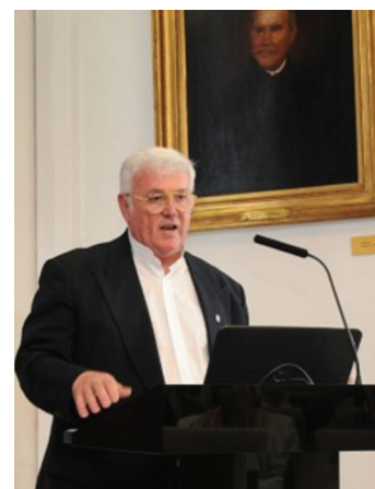
4. ÁBRA: PRO SANITATE-DÍJ