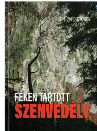
6. ÁBRA: A MÁSODIK AZ ÉLETRŐL SZÓLÓ KÖNYV