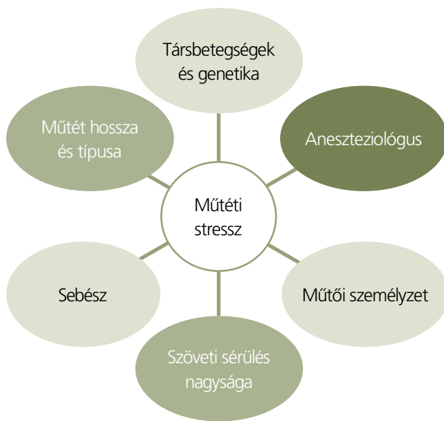
1. ÁBRA: A MŰTETI STRESSZ NAGYSÁGÁGÁT MEGHATÁROZÓ TÉNYEZŐK (GIANNIDUSA 2006)

A colorectalis sebészetben megalkotott, majd más szakmák által átvett, multimodális, támogatott műtét utáni felépülési program, angolul „enhanced recovery after surgery” (ERAS) utak célja az volt, hogy minél inkább stresszmentesen való-