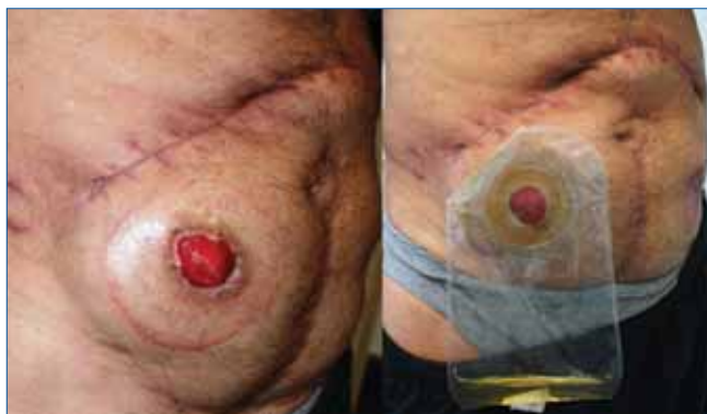
2. ÁBRA: A KÉSZ VIZELETES SZTÓMA ÉS A SZTÓMAZSÁK FELHELYEZVE

Ezek alapján is látszik, hogy ezt a módszert ritkán alkalmazzák. Leggyakrabban definitív epicystostomát képeznek, amely a rendszeres csere – a betegeknek fájdalmas – és gyakori fertőződés, kőképződés miatt nem megfelelő megoldás.