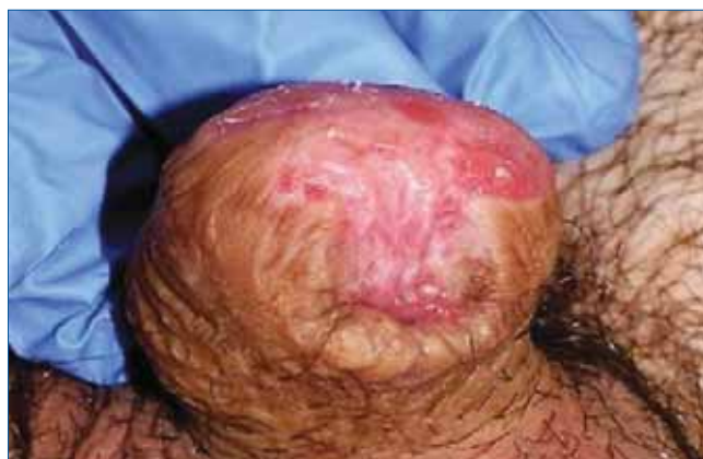
4. ÁBRA: AZ OPERÁLT TERÜLET ELLENŐRZŐ FÉNYKÉPE KÉT ÉVVEL A MŰTÉT UTÁN

niszre nyomókötés került. A patológiai feldolgozás szerint, a reszekált glansot közepesen differenciált elszarusodó laphám töltötte ki, az eltávolítás az épban történt, minimum 1 cm-es ép sebészi széllel (3. ábra). A corpus cavernosum daganatmentes volt, a corpus spongiosum tumoros beszűrődése az urethra vég mucosáját nem érte el. Limfovaszkuláris invázió a mintában nem igazolódott. Stádiumbesorolás pT2 GII. A posztoperatív szak eseménytelen volt, a drén a második, a katéter a hetedik napon lett eltávolítva. A mucosa szabad lebeny megszokott módon gyógyult, először szigetszerűen borítva a végeket, majd a hám teljesen befutotta a neoglans területét. Az új külső húgycsőnyíláson át a vizelet vastag sugárban ürült. Az ellenőrzés negyedévente megtekintésből (4. ábra), szonográfiából, évente hasi-, kismencei CT-ből és mellkasröntgenből állt, a rutin laborvizsgálatok mellett. A maradéktalan eltávolítás, a recidívamen-