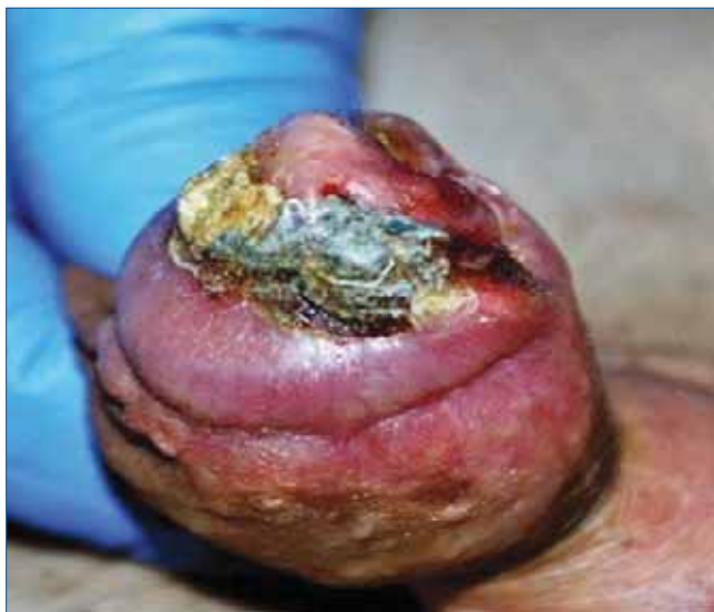
1. ÁBRA: FÉNYKÉPFELVÉTEL A GLANSOT CSAK NEM ELFOGLALÓ, NEKROTIKUS FELSZÍNŰ DAGANATRÓL