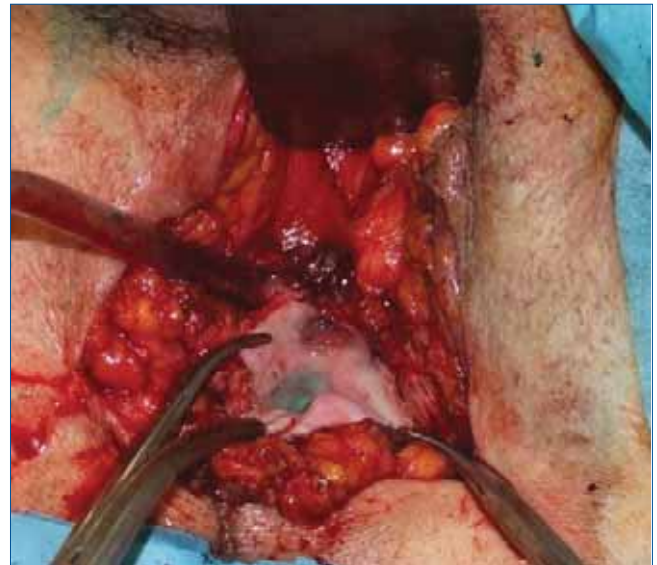
2. ÁBRA: HOSSZÁBAN BEHÁSÍTOTT DIVERTIKULUMZSÁK, AMELYBEN METILÉNKÉKKEL SZÍNEZETT FIZIOLÓGIÁS SÓOLDAT LÁTSZIK, AMELYET A DIVERTIKULUMNYAK AZONOSÍTÁSA CÉLJÁBÓL ADTUNK BE HÓLYAGKATÉTEREN KERESZTÜL

A férfi húgycsődivertikulumok 67-90%-a szerzett, ezek nagy része húgycsőszűkület, infekció és trauma következtében alakul ki