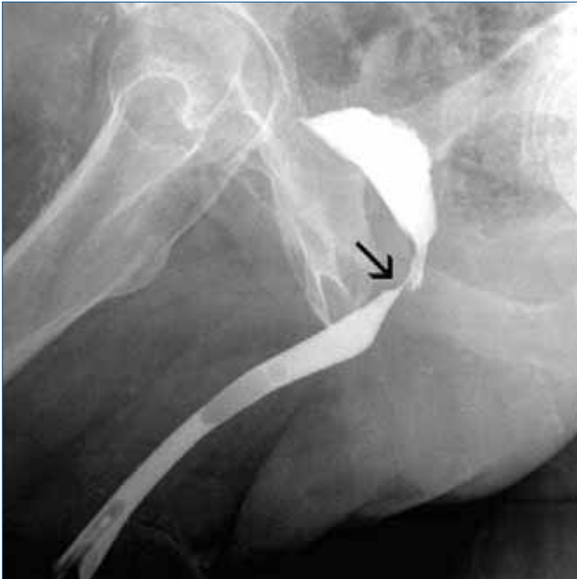
3. ÁBRA: A DIVERTICULECTOMIA UTÁN HÁROM HÉTTEL KÉSZÜLT RETROGRÁD URETHROGRAM EXTRAVASATIOT NEM MUTAT. A NYÍL AZ 1. KÉPEN IS LÁTHATÓ MEMBRANOSUS HÚGYCSŐSZAKASZT MUTATJA

csőtágulat (11, 12). Nem egyértelmű diagnózis esetében további vizsgálatok, mikciós uretrográfia, medence MR- és transrectalis UH-vizsgálat lehet a segítségünkre (5, 13).