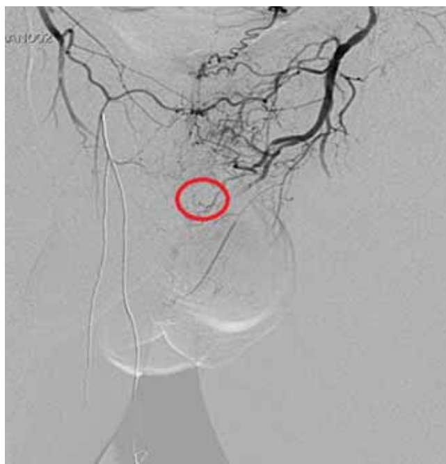
2. ÁBRA: A KONTRASZTANYAG-KILÉPÉS MEGSZÜNT AZ EMBOLIZÁCIÓ UTÁN