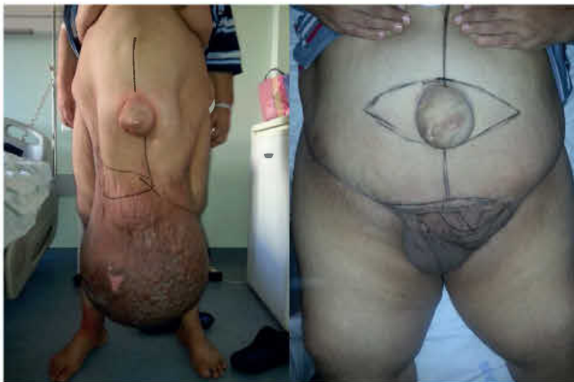
5. ÁBRA: MASSZÍV SCROTALIS ELEFANTIÁZIS – PRE- (BALRA) ÉS POSZTOPERATÍV KÉP (JOBBRA) (2016)

kutatási közlemény is szerepel, 5 klinikai szignifikanciával nem rendelkező leírat mellett.