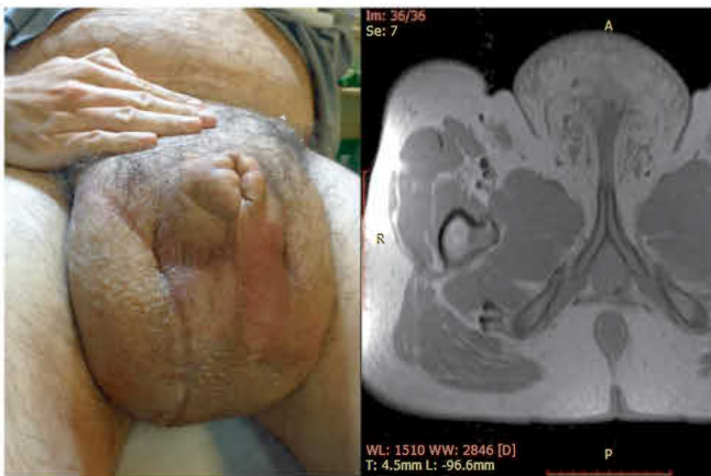
4. ÁBRA: FUTBALLABDÁNYI SCROTUM, MEGVASTAGODOTT BŐRREL, ALIG TAPINTHATÓ HÍMVESSZŐVEL (BALRA) ÉS MR-FELVÉTEL A GENITÁLIS ELEFANTIÁZISSAL (JOBBRA) (2015)