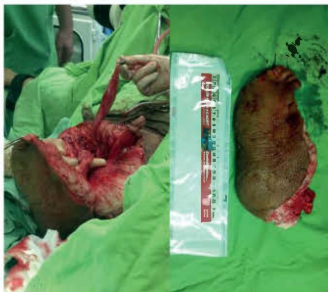
1. ÁBRA: AZ ÖDÉMÁS SZÖVEK RESZEKCIÓJA SORÁN KIKÉSZÍTETT HÍMVESZŐ ÉS HEREVEZETÉKEK (BALRA) ÉS A RESZEKÁLT ÖDÉMÁS SCROTUM (JOBBRA) (2012)

sebészeti vizsgálat) alkalmazása javasolt az esetleges malignitások kizárására!